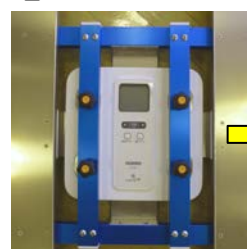
HBF-922 (ご購入時のヘルスマーター)