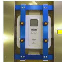
HBF-922 (ご購入時のヘルスマーター)