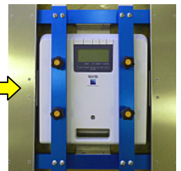
WB-260A (検定付ヘルスマーターに交換した例)